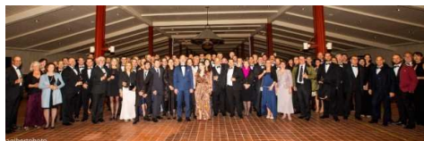
La soirée de gala avait lieu à la Robert Mondavi winery

Pour rendre hommage à leurs clients américains, qui représentent de loin leur premier marché export, les tonneliers français se sont réunis en congrès à Napa, en Californie, le 1er février dernier.