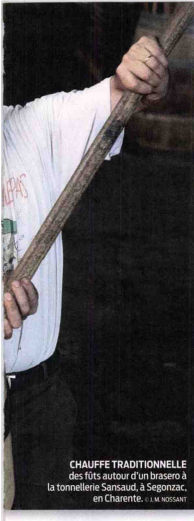
CHAUFFE TRADITIONNELLE des fûts autour d'un brasero à la tonnellerie Sansaud, à Segonzac, en Charente.