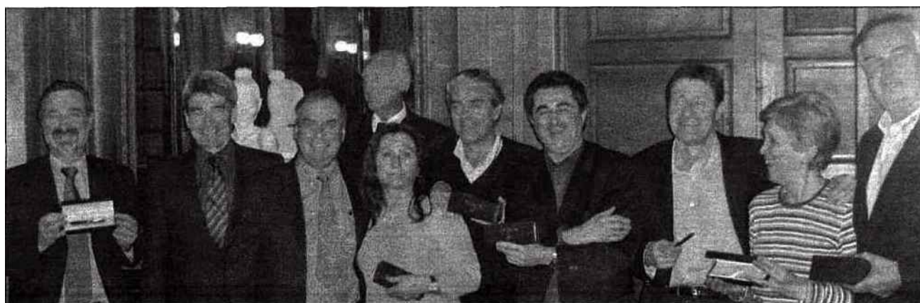
Les tonneliers ont rencontré les œnologues.